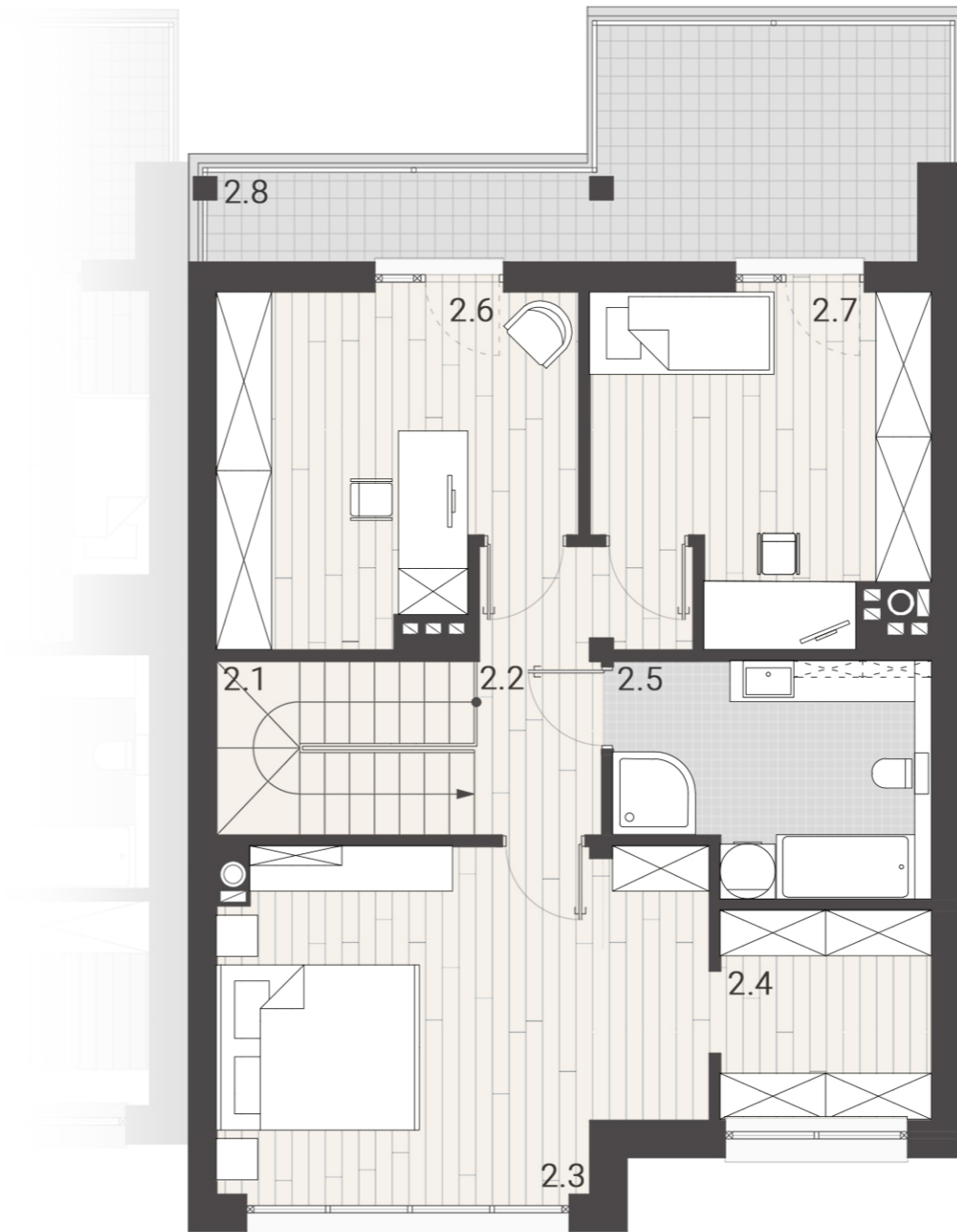
PIĘTRO (przykładowa aranżacja)