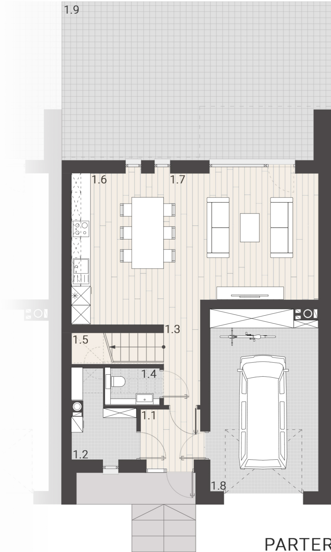
PARTER (przykładowa aranżacja)